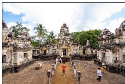
ปราสาทสด๊กก๊อกธม