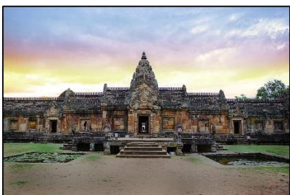
ปราสาทเขาพนมรุ้ง

อาจอนุมานได้ว่าดินแดนในเมืองพระนครกับนครรัฐไทยในอดีตอาจเป็นบ้านเมืองร่วมกัน ไม่ใช่เมืองส่งบรรณาการหรือประเทศราชที่ได้มาจากการรุกรานด้วยกำลังทหาร อีกทั้งคงไม่มีใครไปลงทุนก่อสร้างปราสาทขนาดใหญ่ในพื้นที่ซึ่งไม่ใช่ของตนเอง แม้แต่กรณีศึกษาสยามประเทศสมัยต้นรัตนโกสินทร์ได้ปกครองอาณาจักรล้านช้าง (ลาว) และอาณาจักรล้านนารวมถึงเขมรมาเป็นประเทศราชแต่ไม่พบการก่อสร้างขนาดใหญ่รวมถึงก่อสร้างวัดสำคัญในประเทศเหล่านั้น ที่กล่าวนี้เป็นเพียงข้อสันนิษฐานส่วนตัวขาดหลักฐานบ่งชี้ทางวิชาการ