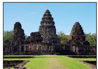
ปราสาทเขาพิมาย